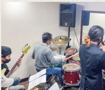
発表会直前のリハーサル中です。