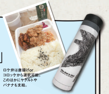
ロケ弁は唐揚げor コロッケから選択可能。このほかにヤクルトやバナナも支給。